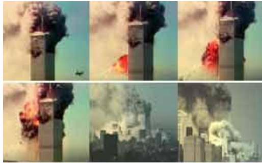
La drammatica sequenza

Alle 8 e 45 dell'11 settembre 2001 un Boeing 767 della United Airlines si schianta su una delle Torri Gemelle di New York. Poco dopo un secondo aereo colpisce la Torre Sud, mentre un terzo aereo si schianta sul Pentagono, sede del Dipartimento della Difesa, a Washington un quarto aereo con 45 passeggeri a bordo precipiterà poco dopo in Pennsylvania vicino a Pittsburg.